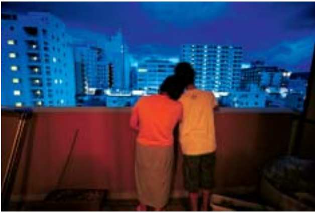
壊れた脳とともに生きる - 山田規敏さんの暮らし