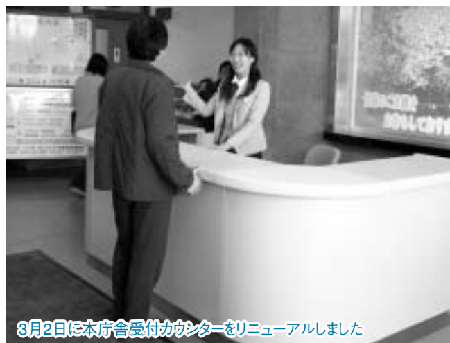
3月2日に本庁舎受付カウンターをリニューアルしました