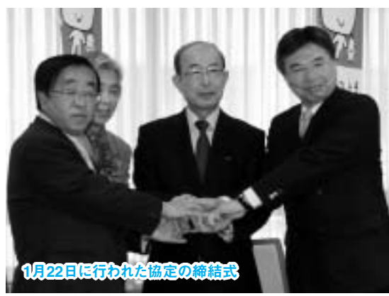
1月22日に行われた協定の締結式

※1月末現在で、無料配布を中止する予定の店舗です。 ※有料レジ袋の価格は、1枚5円程度で各事業者が決定します。