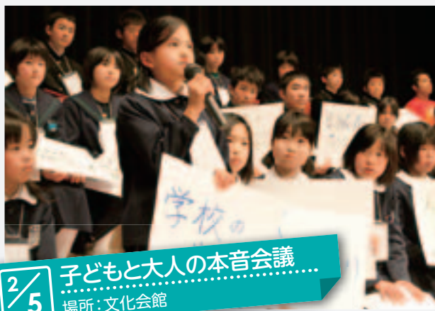
2/5 子どもと大人の本音会議 場所：文化会館