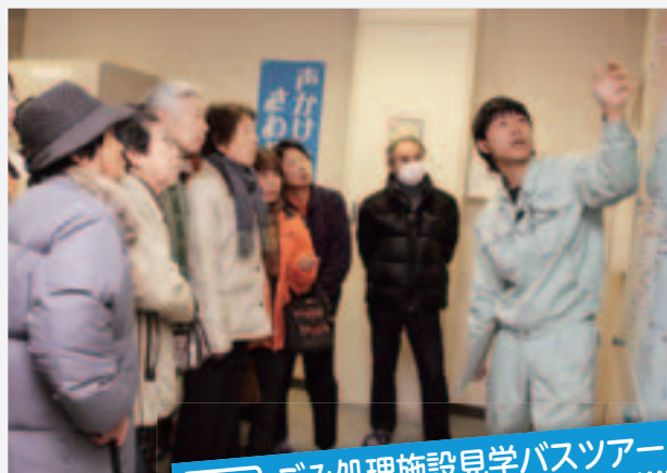
2/9 ごみ処理施設見学バスツアー 場所：ごみ燃料化施設 フェニックス周辺

家庭から出るごみを処理する施設の見学バスツアーが開催され、午前と午後、合わせて54人が参加しました。今回は、可燃ごみを燃料に変える施設フェニックスと4月から稼働を始めるリサイクルプラザを訪問。参加した皆さんは、職員の案内で施設の中を見学し、ごみが処理されていく工程を熱心に見つめていました。