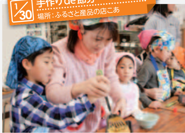
1/30 手作りde節分 場所：ふるさと産品の店こあ

節分にちなんだイベントが、ふるさと産品の店こあで行われました。参加した5家族は、親子で手作り巻寿司に挑戦。子どもたちは、卵焼きを作ったり、巻寿司の具を包丁で切ったりと、緊張しながらも真剣に取り組んでいました。巻寿司を食べた後は、外でゲームをするなど、雪が舞う寒い日でしたが、参加した皆さんは心温かな講座を満喫していました。