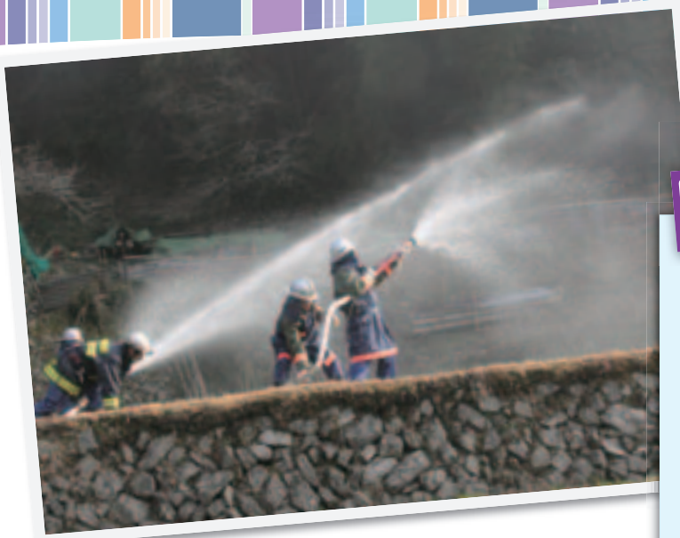
1/23 山火事対応訓練 場所：徳山西総合グラウンド、湯野地区下河合