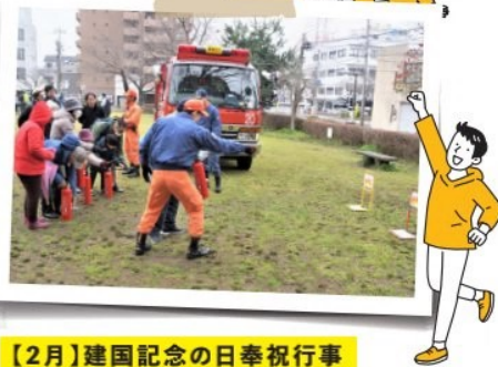
【2月】建国記念の日奉祝行事

2つの地区が隔年で行事の内容を企画します。この年はいざという時に備えて防災学習。うまく消火できたかな？