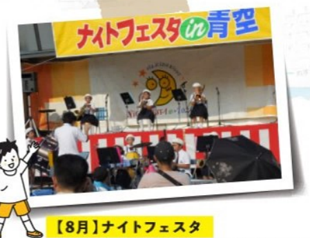
【8月】ナイトフェスタ

6月には関門地区、10月には中央地区の運動会が開催されます。大人も子どもも夢中！