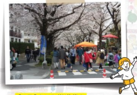
【3月】さくら街道祭り

2つの地区が隔年で行事の内容を企画します。この年はいざという時に備えて防災学習。うまく消火できたかな？