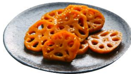
春の根野菜で作る韓国の伝統菓子「ジョンガ(正菓)」

申込方法 電話または窓口 学び・交流プラザ 0834-63-1188 受付期間 令和6年2月5日(月)~16日(金) 受付時間 9時00分~17時15分 土日、祝日を除く