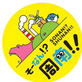
オブジェクトの回転