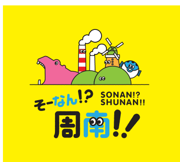
同系色背景への配置