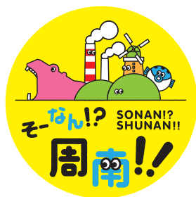
オブジェクトの移動