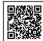
違反対象物公表制度