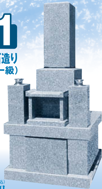
◎8寸2重型舞台付墓石(フタ石式)