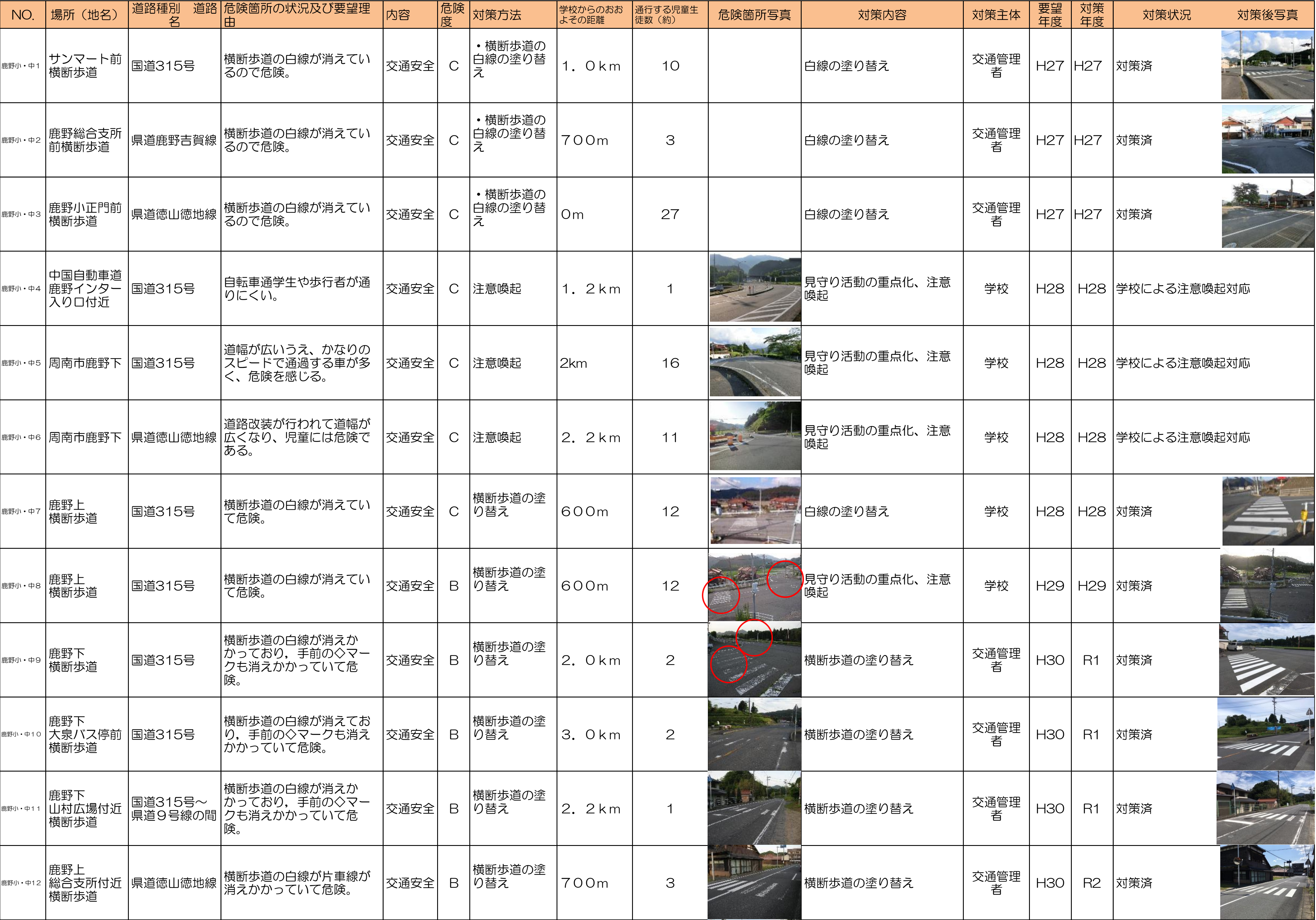
周南市通学路対策一覧表(令和6年6月)