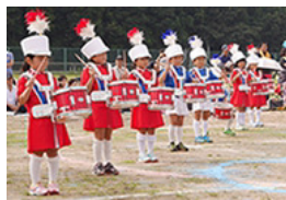
運動会・マーチング