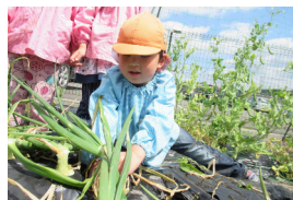
食育・野菜の収穫