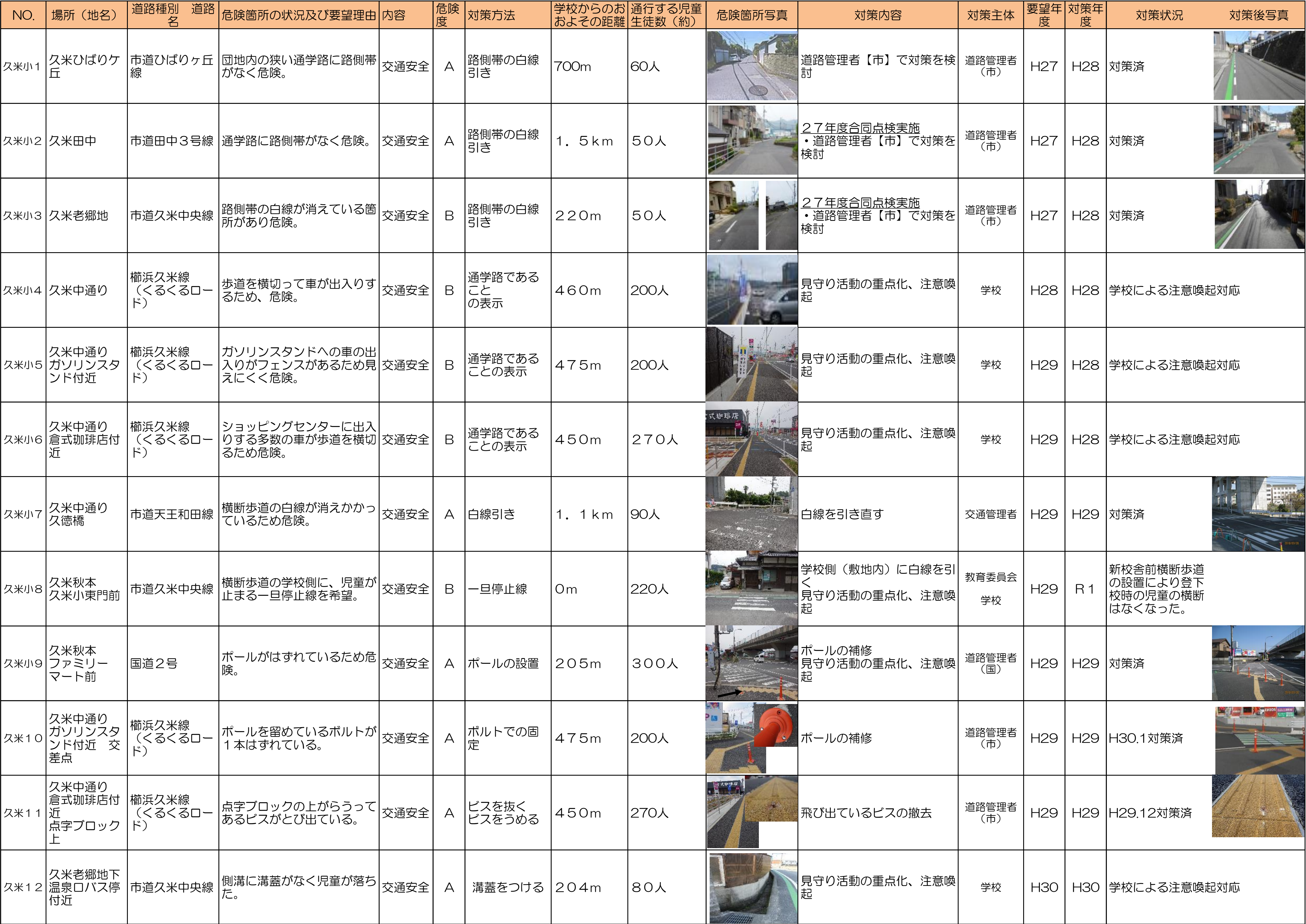
周南市道路対策一覧表(令和7年5月)