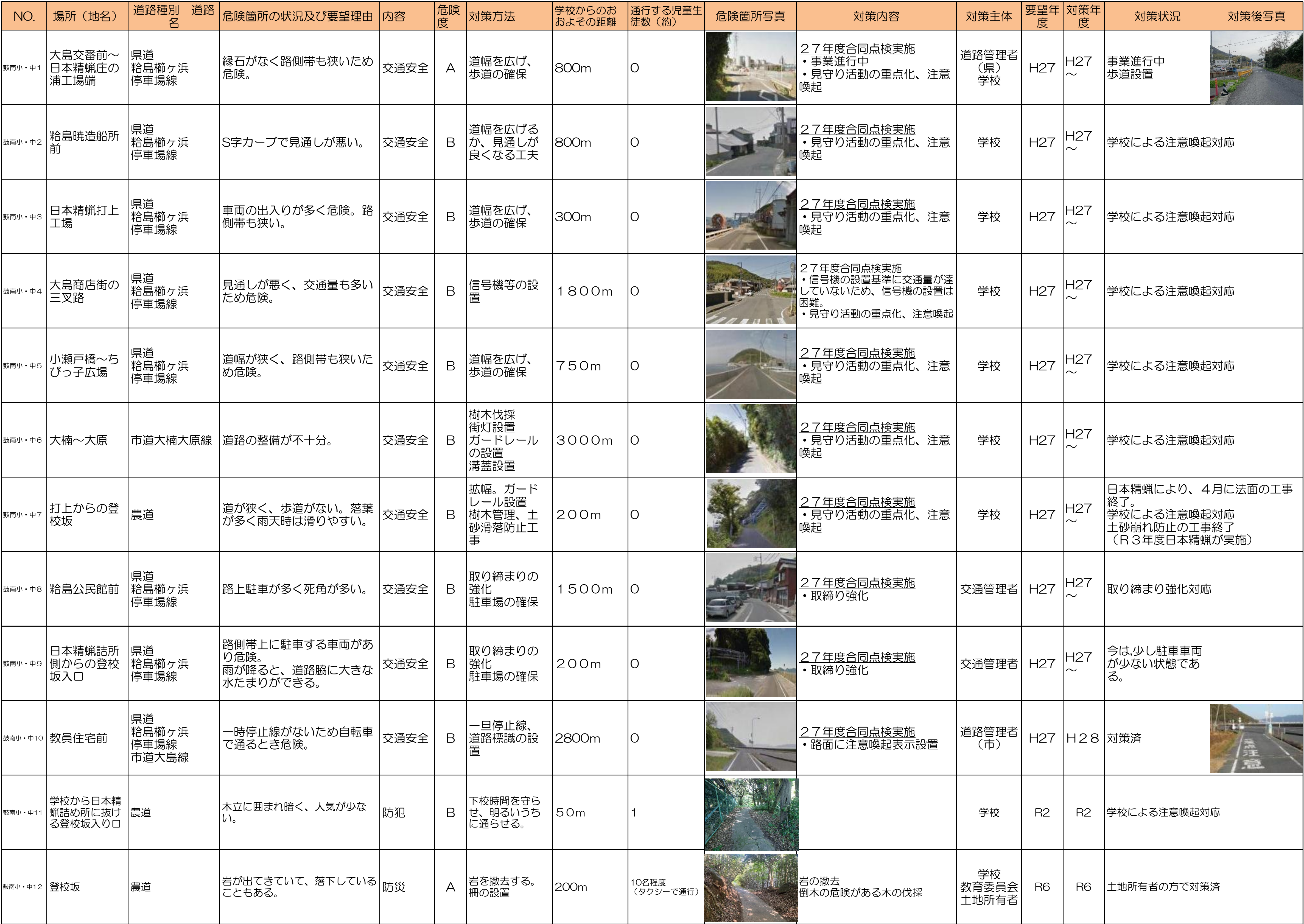
周南市通学路対策一覧表(令和7年5月)