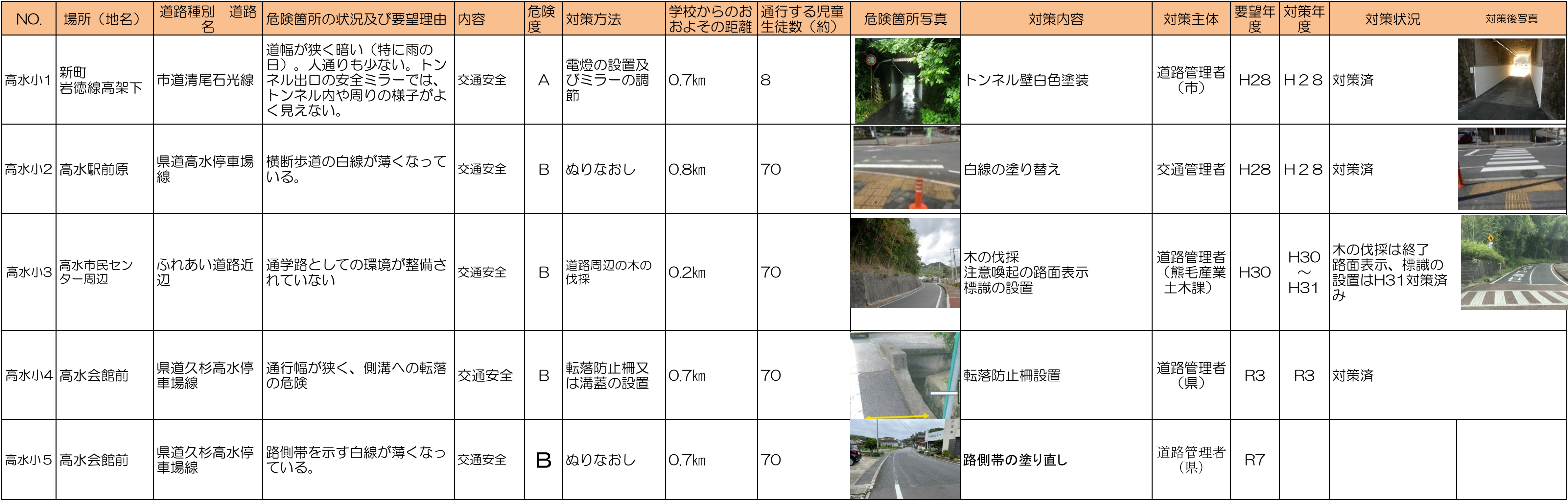
周南市通学路対策一覧表(令和7年6月)