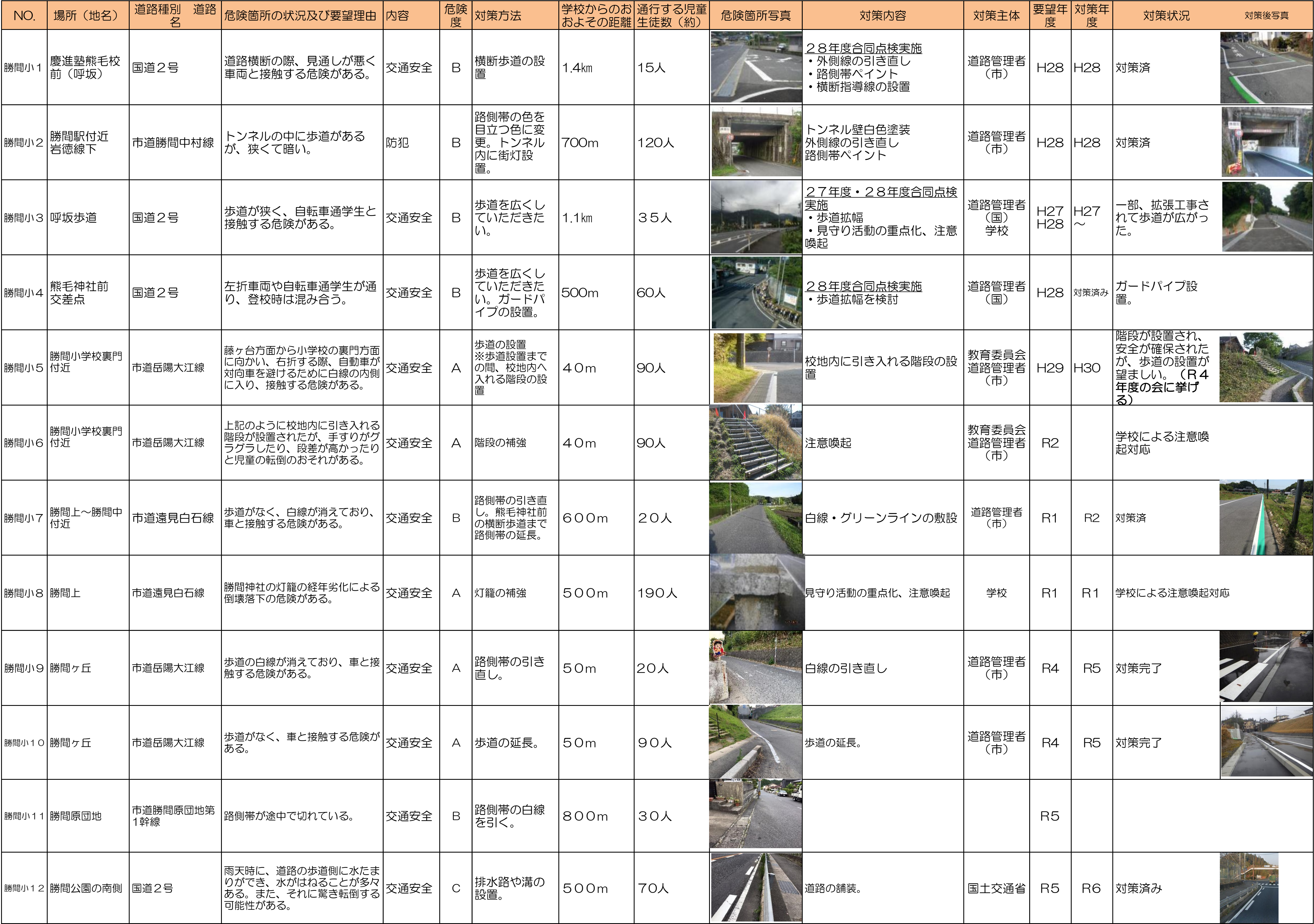
周南市通学路対策一覧表(令和7年6月)