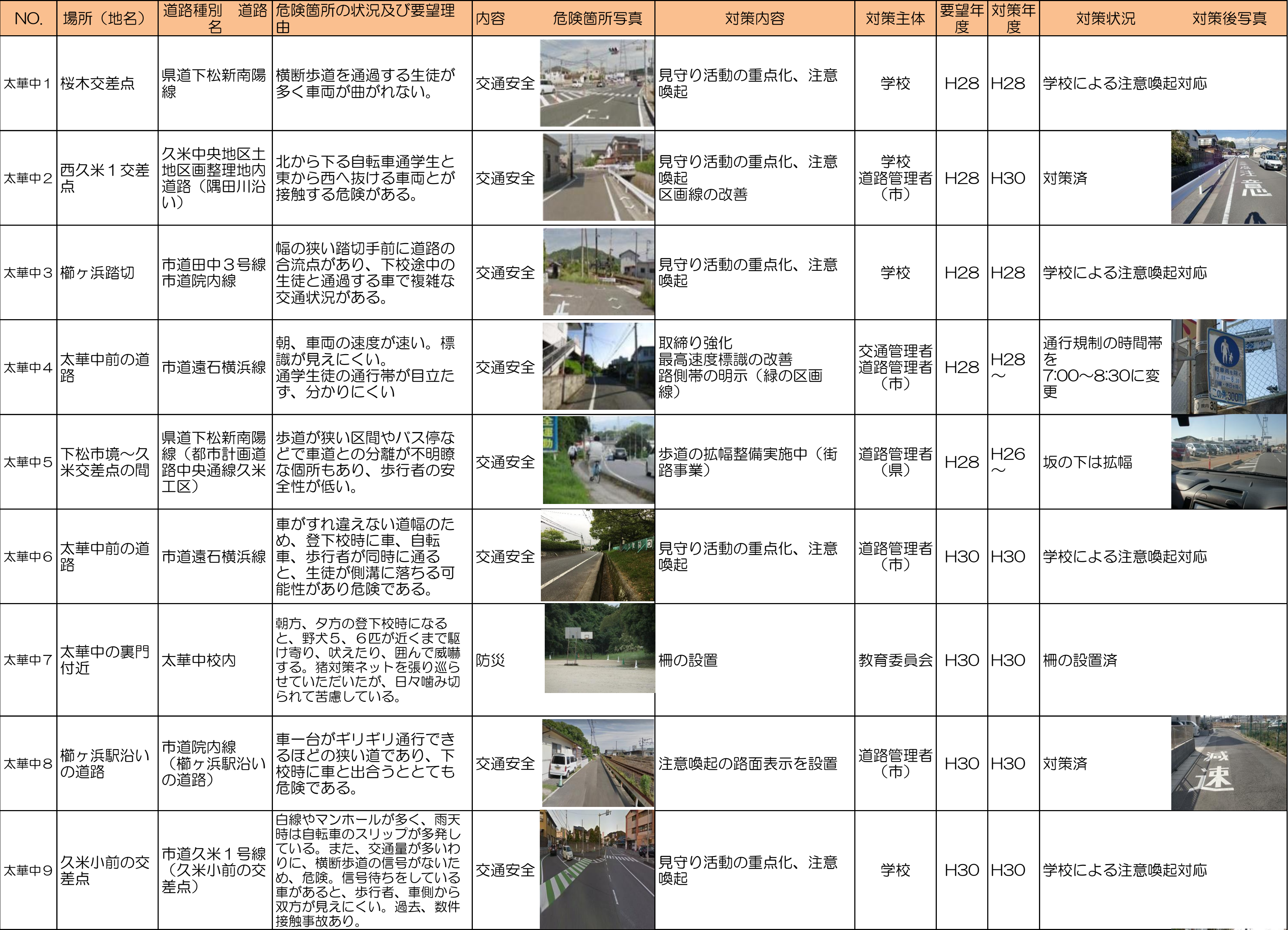
周南市通学路対策一覧表(令和7年6月)