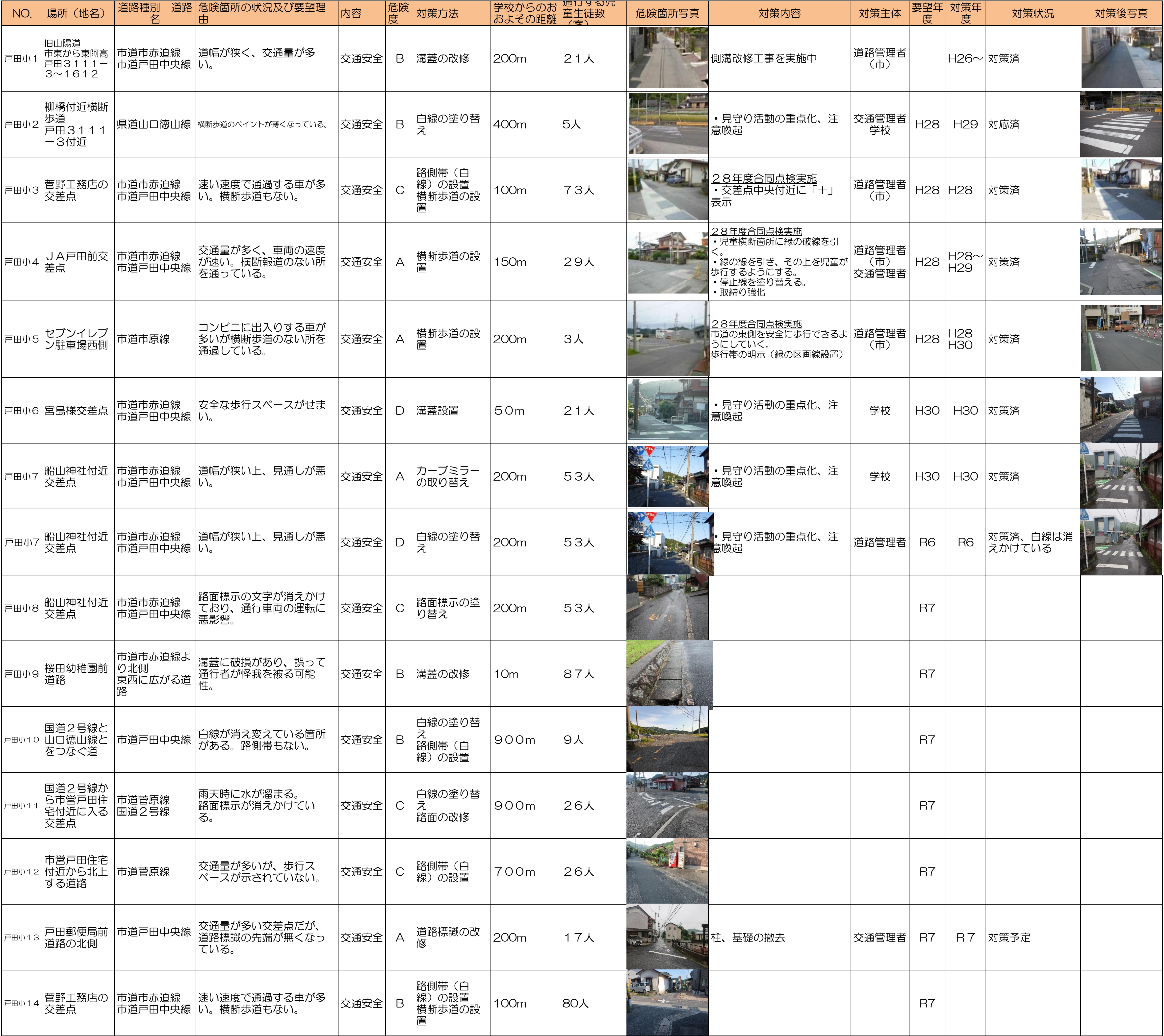
周南市通学路対策一覧表(令和7年5月)