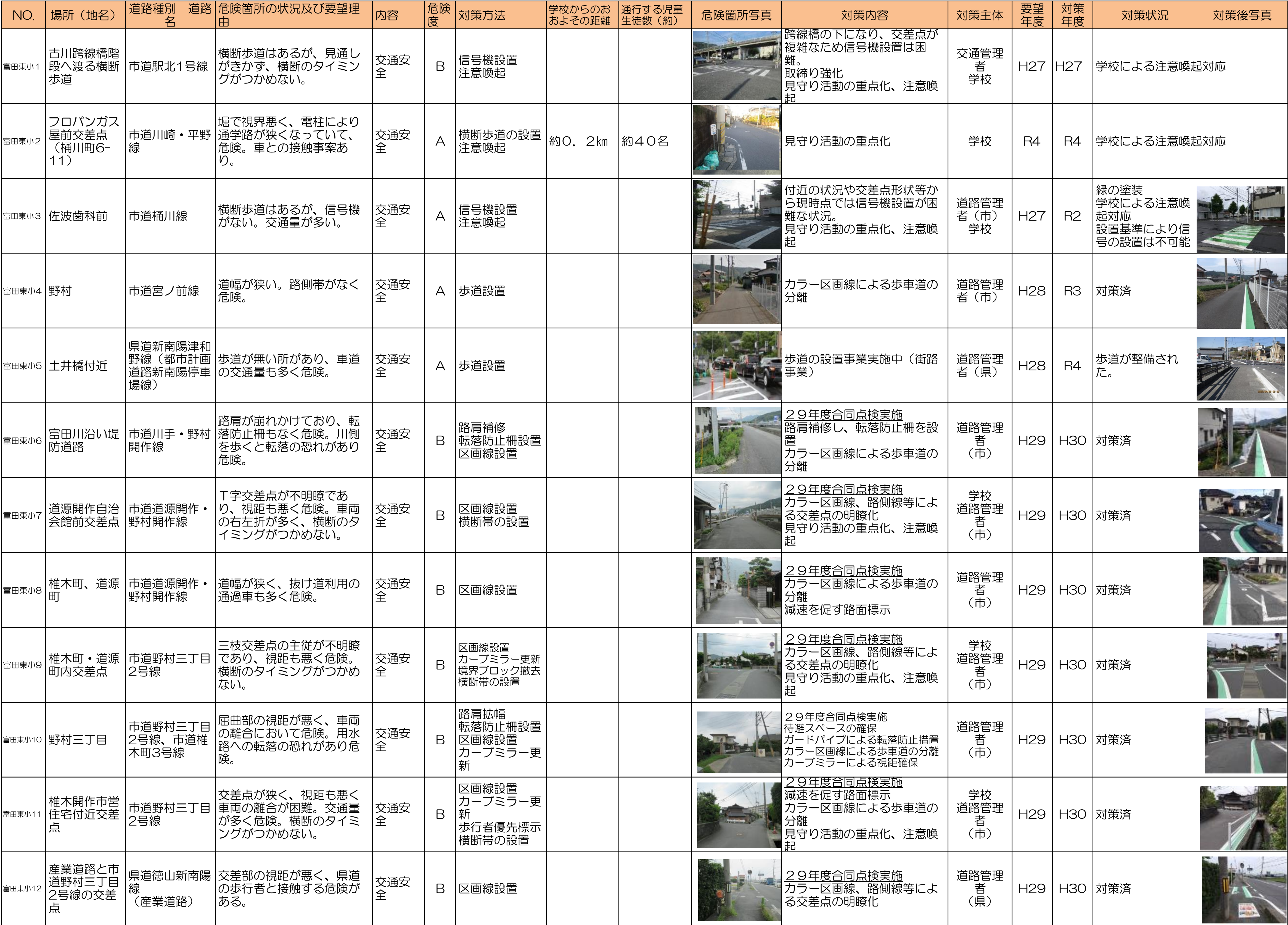
周南市通学路対策一覧表(令和7年6月)