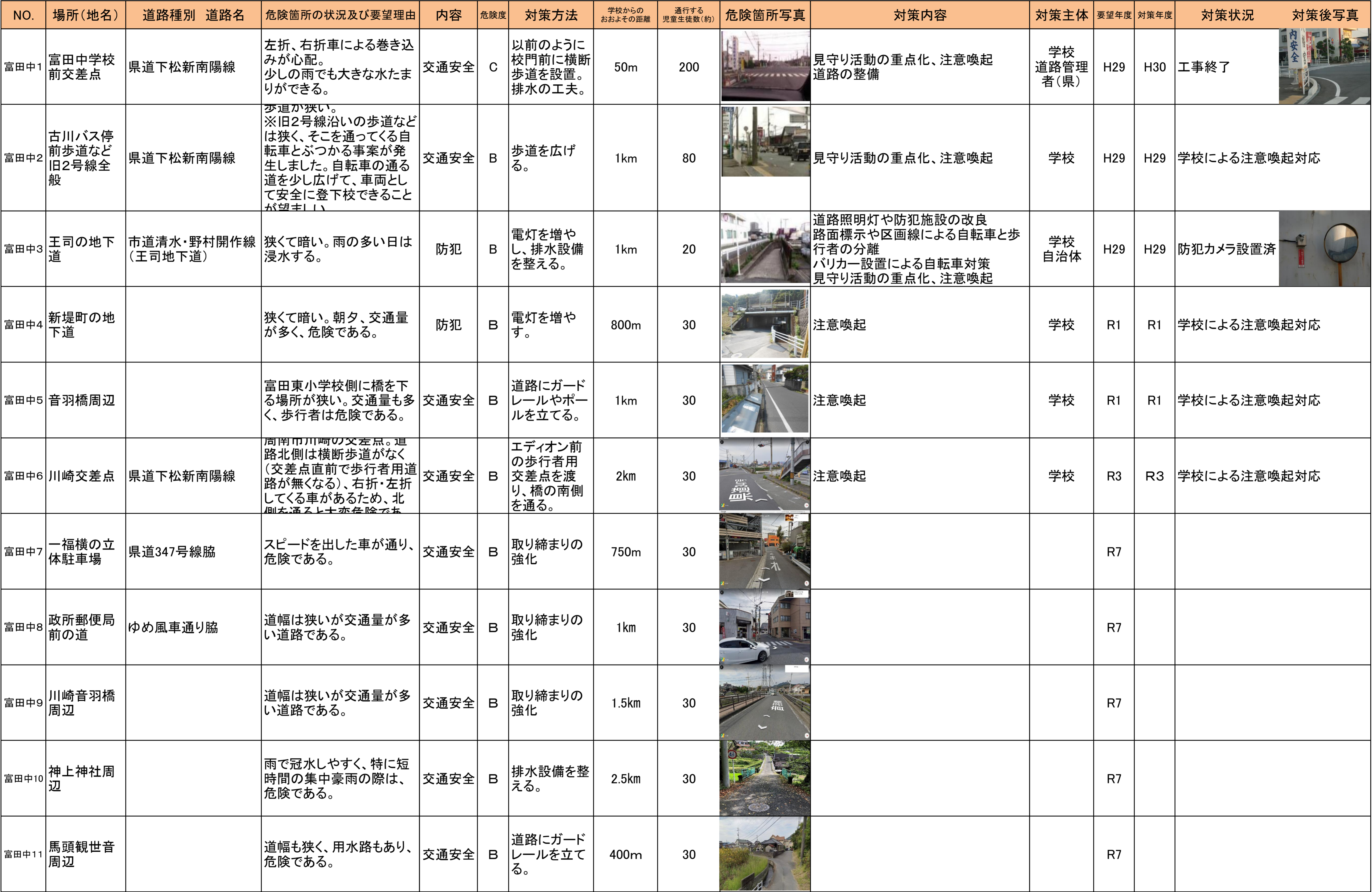
通学路危険箇所一覧表(令和7年5月)