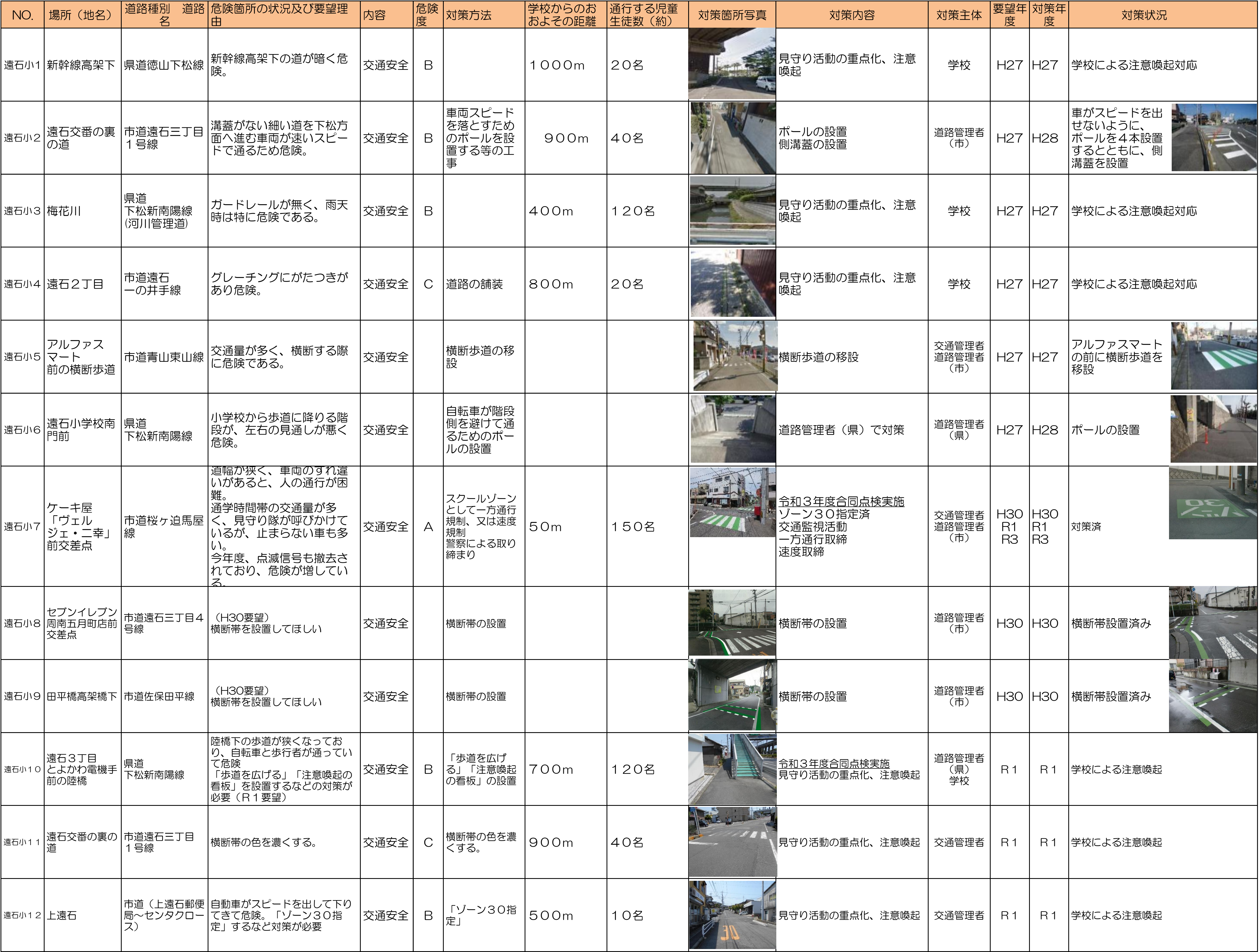
周南市通学路対策一覧表(令和7年5月)