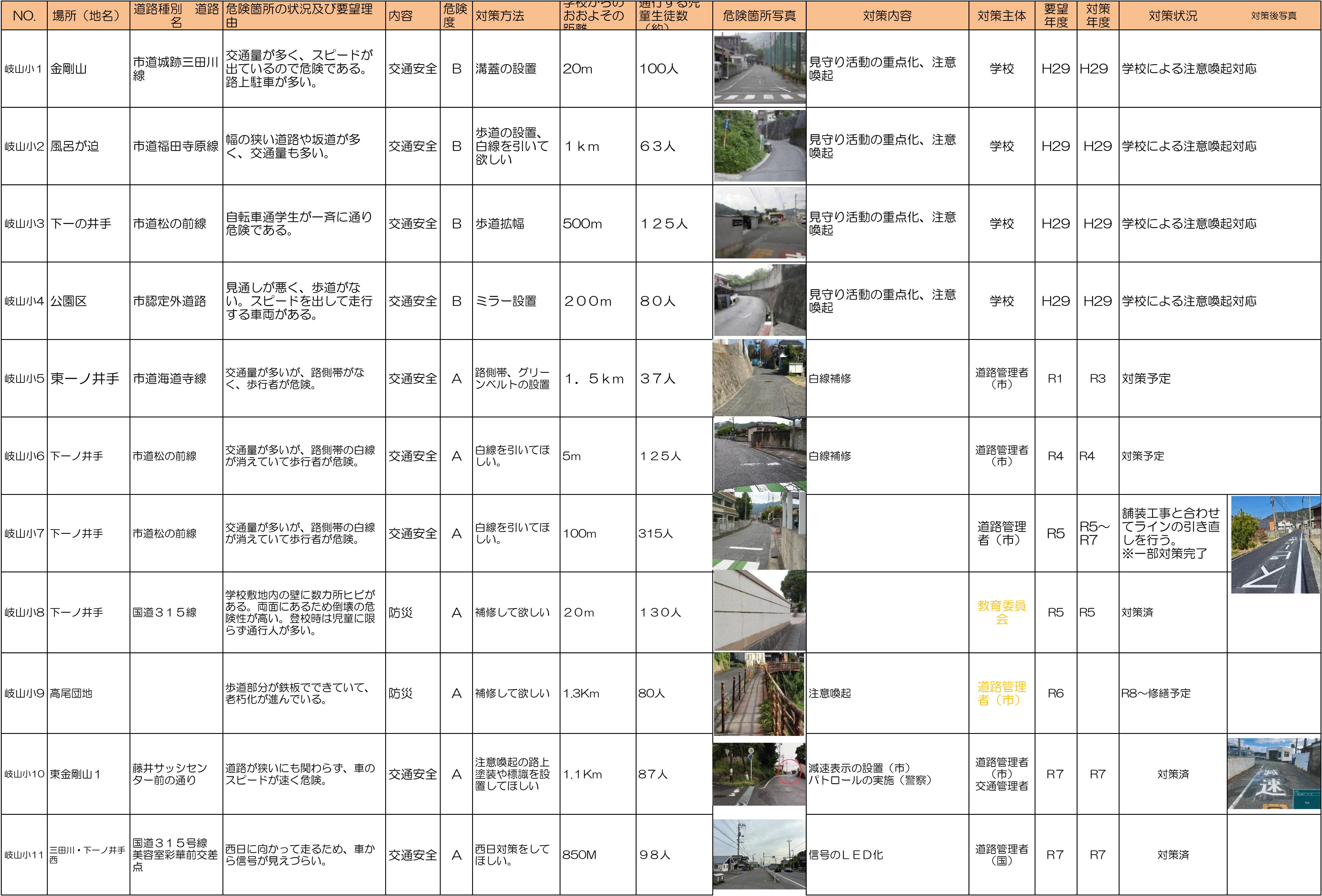
周南市通学路対策一覧表(令和7年6月)