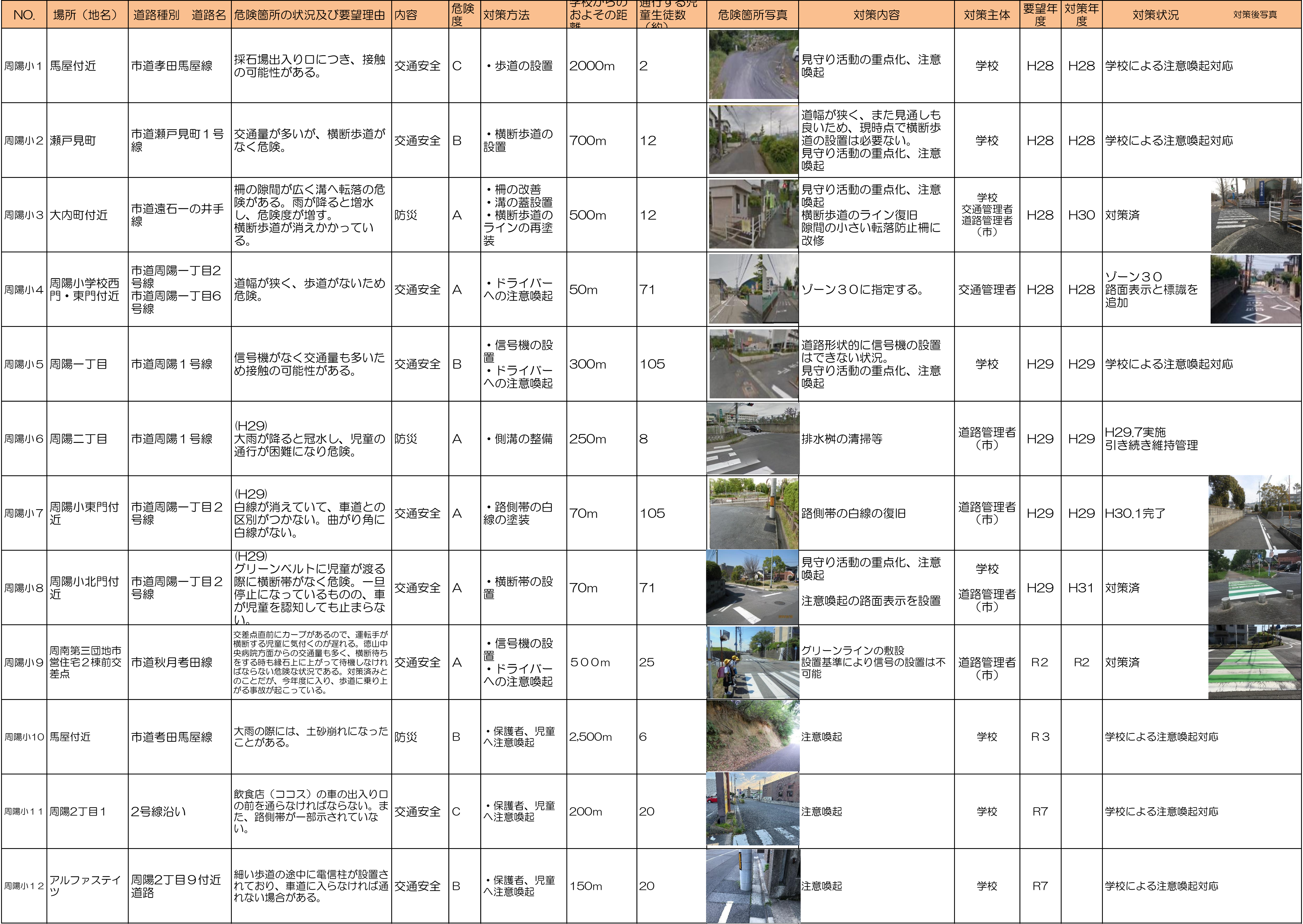
周南市通学対策一覧表(令和7年6月)