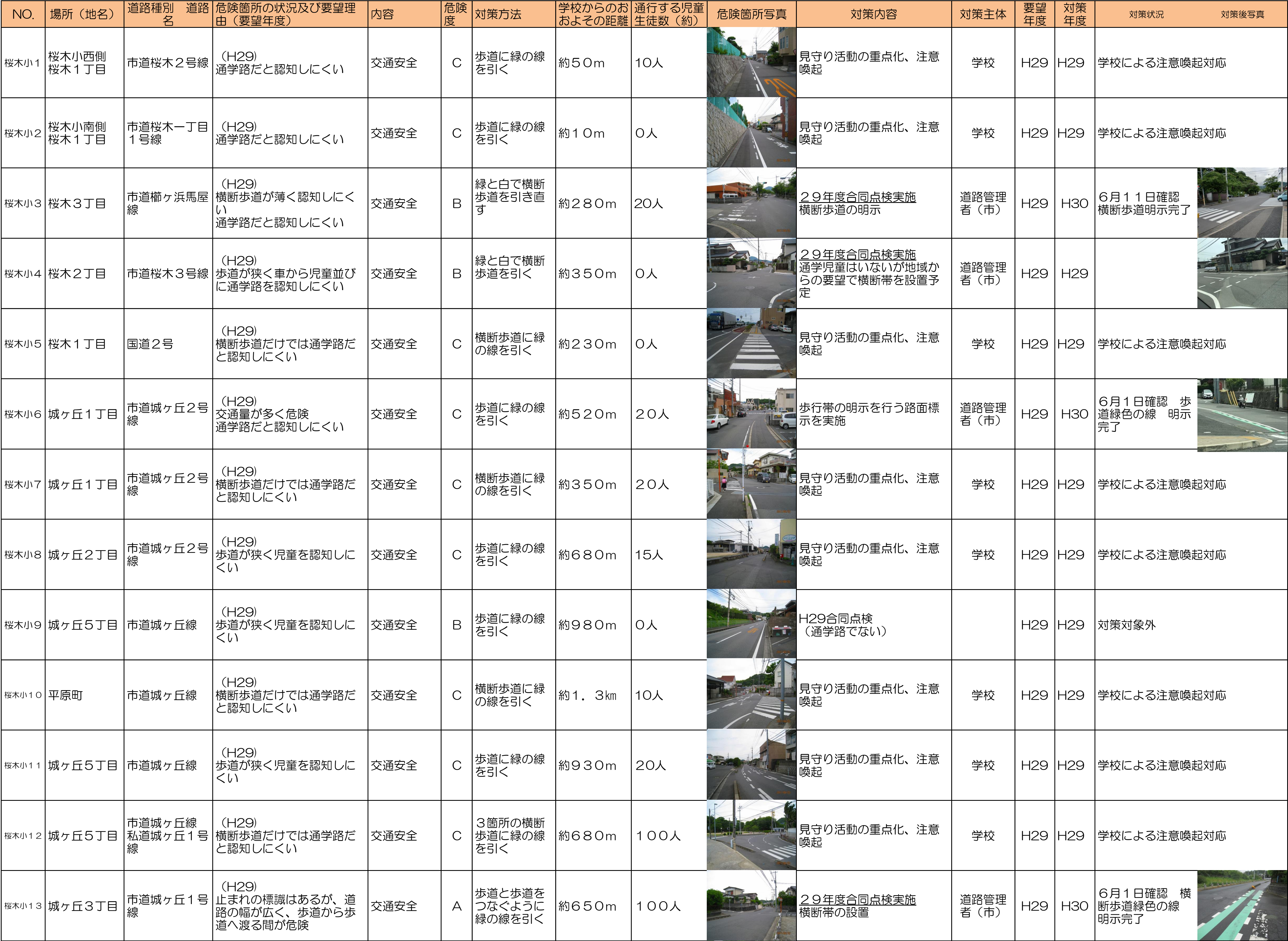
周南市通学路対策一覧表(令和7年5月)