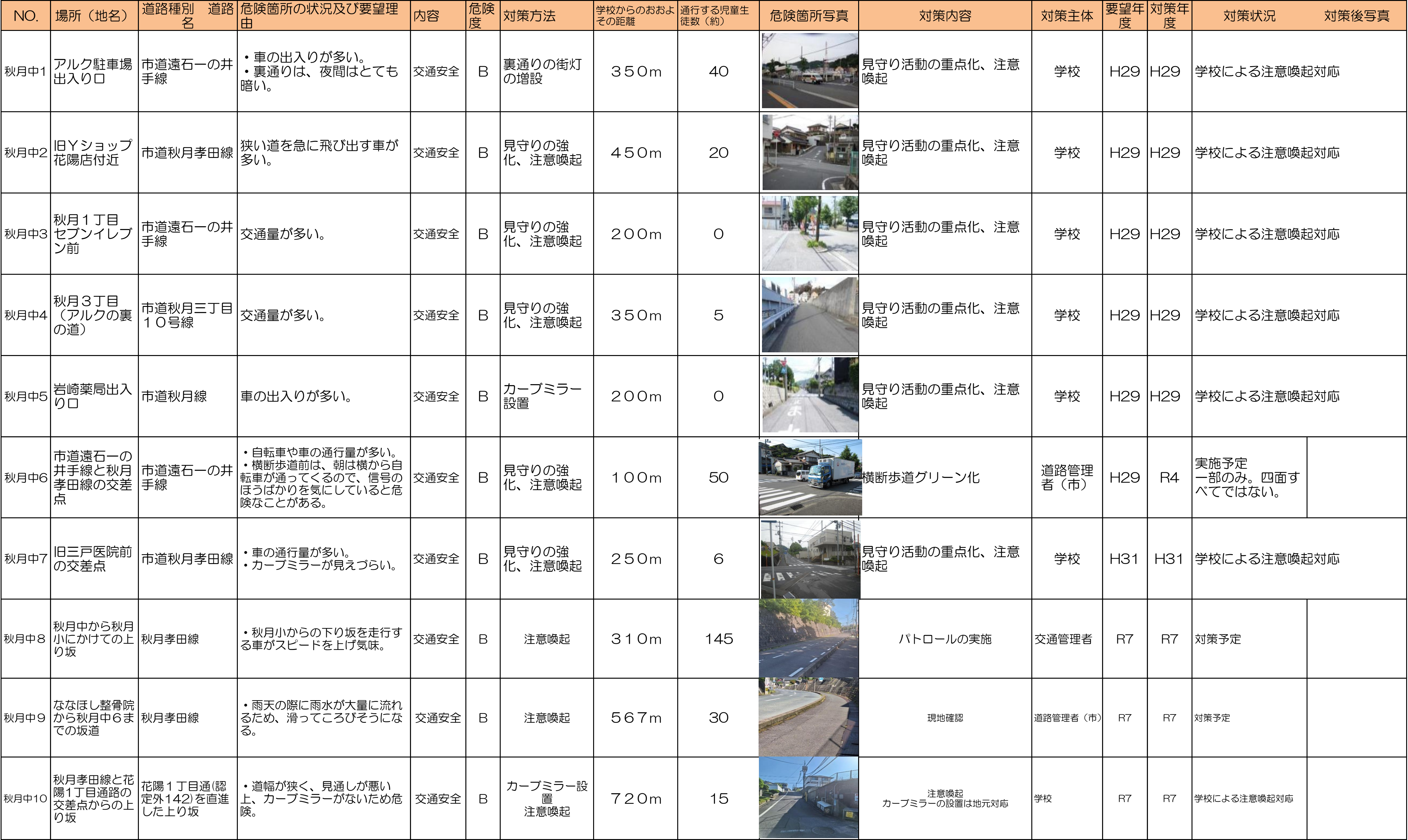
周南市通学路対策一覧表(令和7年5月)