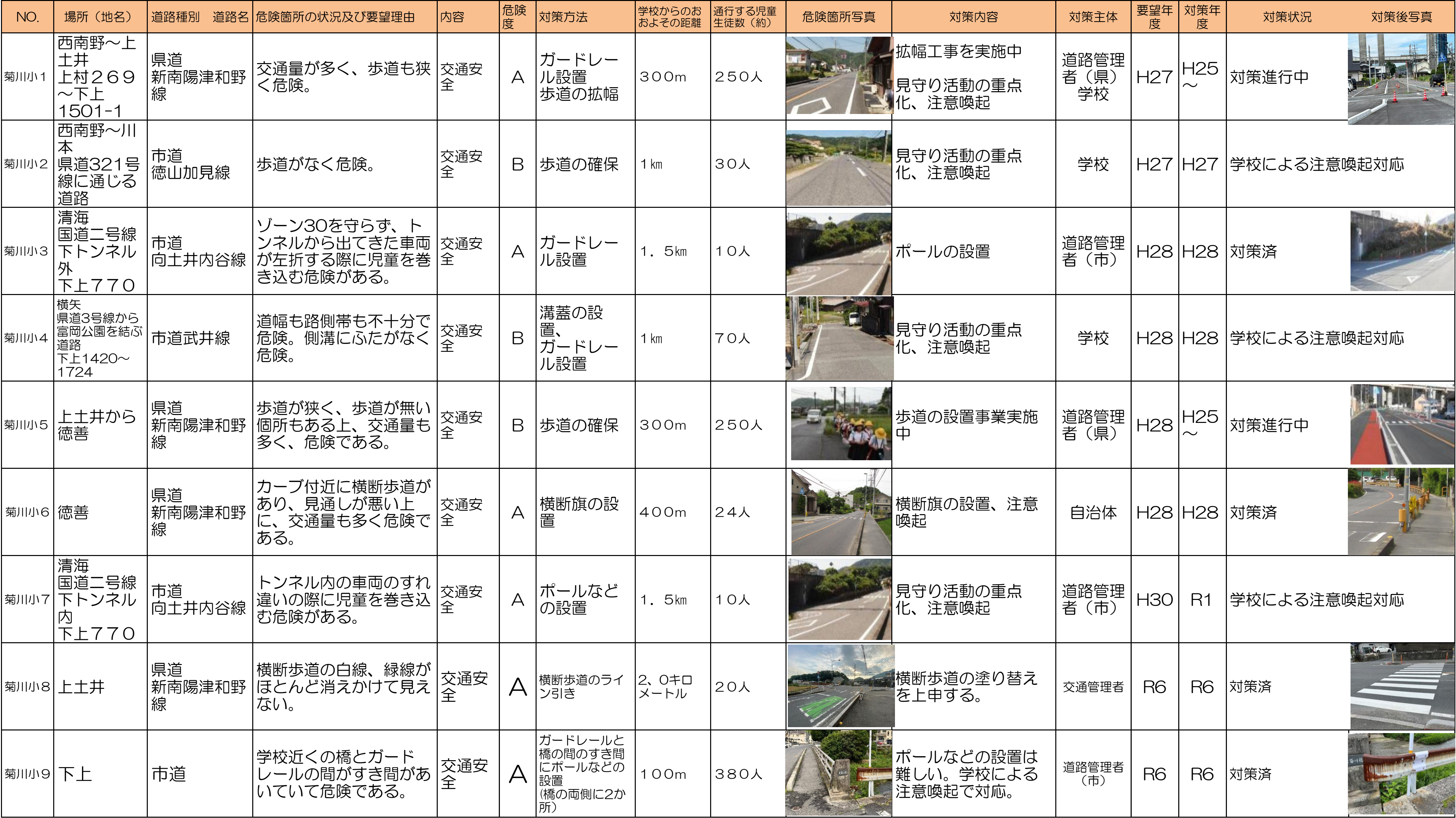
周南市通学路対策一覧表(令和7年5月)