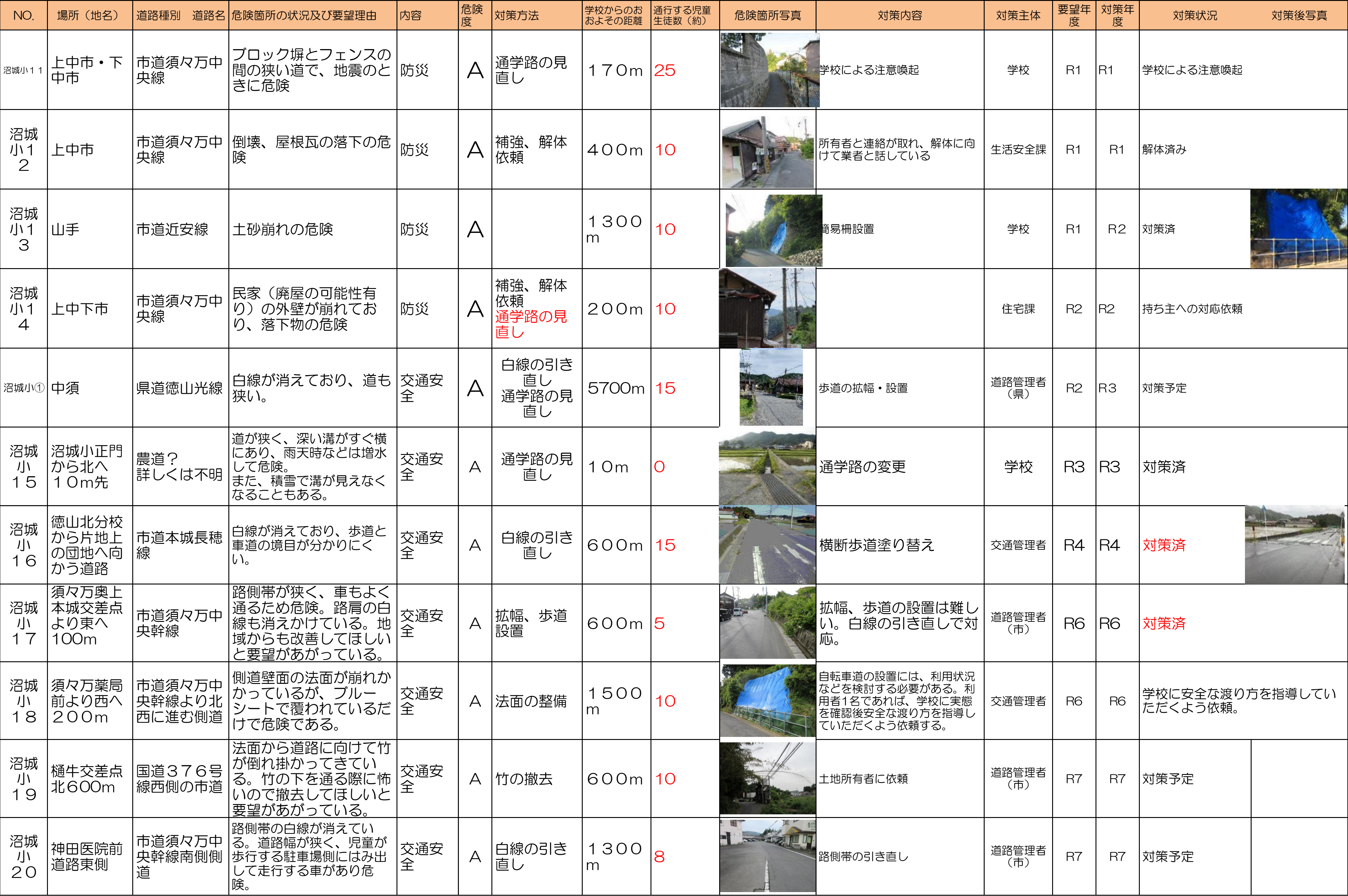
周南市通学路対策一覧表(令和7年5月)