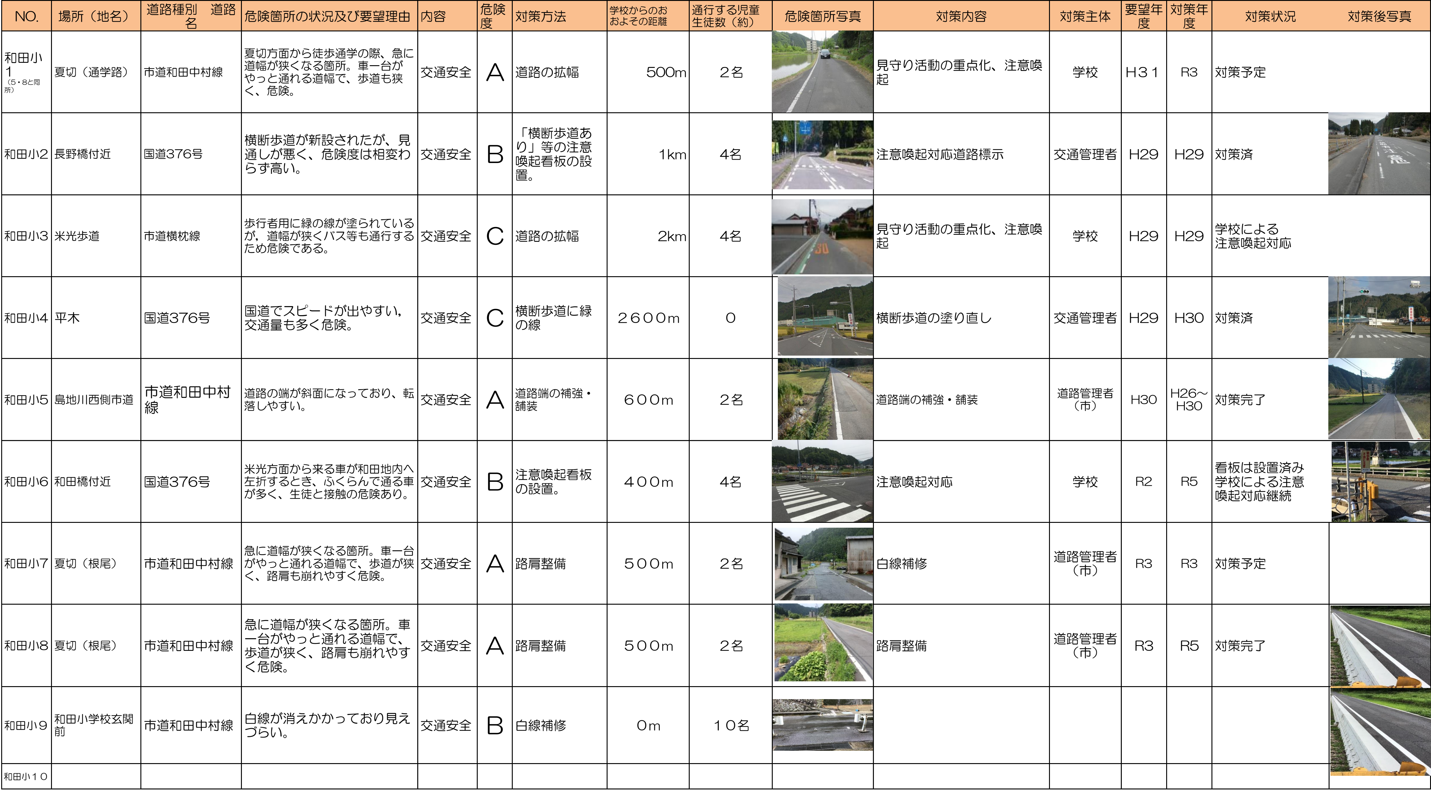
周南市通学路対策一覧表(令和7年5月)