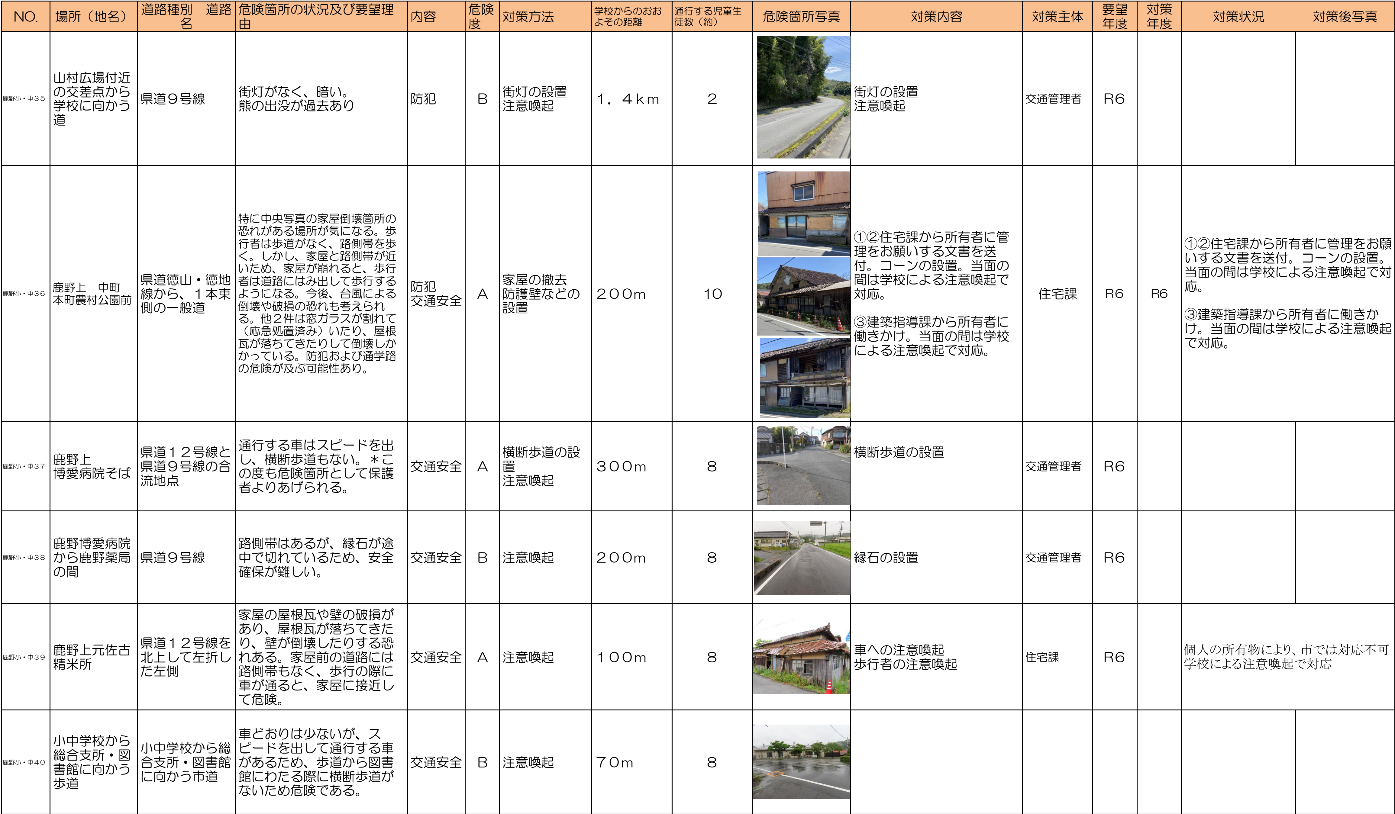
周南市通学路対策一覧表(令和7年5月)