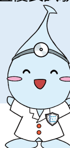
Dr. すいどー (マスコットキャラクター)