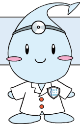
Dr. すいどー (マスコットキャラクター)