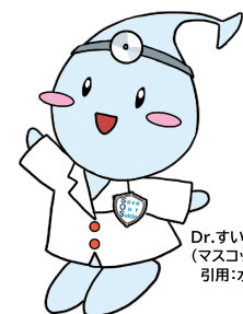
Dr. すいどー (マスコットキャラクター) 引用:水道PRパッケージ

水は、私たちにとって欠かすことのできない限りある大切な資源であり、有効に使っていただかなければなりません。