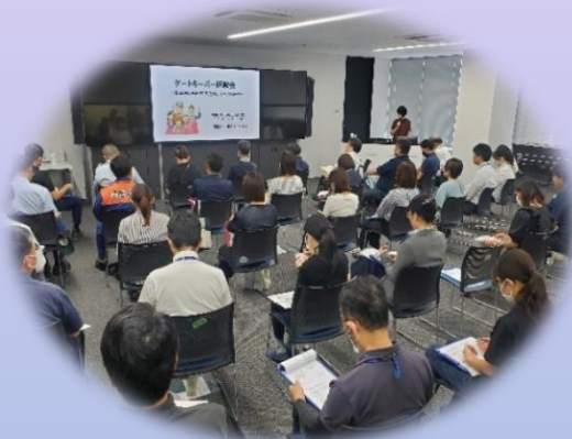
ゲートキーパー研修の様子

周南市健康づくり推進課 〒745-0005 周南市児玉町 1-1 TEL: 0834-22-8553 FAX: 0834-22-8555 Mail: kenkozo@city.shunan.lg.jp