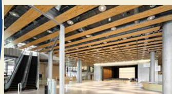
出会い・交流創出機能