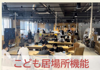
こども居場所機能