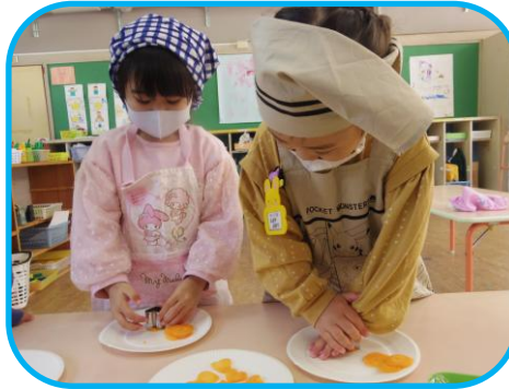
育てた野菜等でクッキング