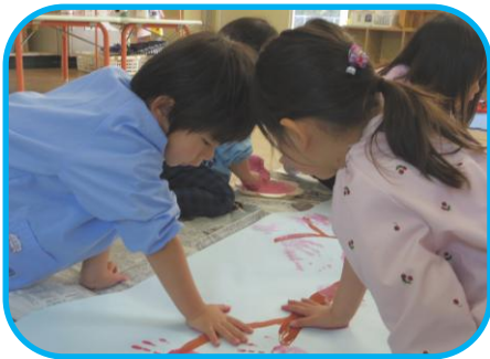
「やってみたい」を大切にしながら いろいろな遊びを体験