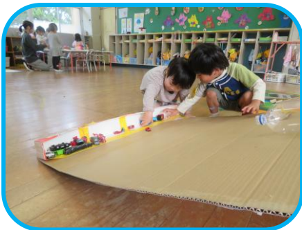
「こうしてみよう、ああしてみよう」 いろいろ考えながら…