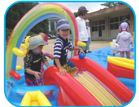
季節ならではの遊びも思い切り 楽しめます