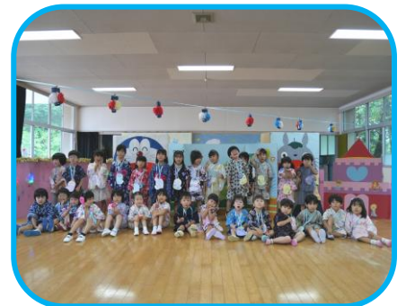
保護者の方が開いてくださる なかよしおまつり会