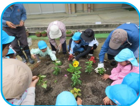
地域の方と一緒に花作り

安心して生活できる場 優しい気持ちを通い合う場 試したり発見したりできる場 互いに認め合える場