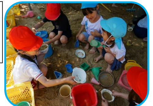
小学生との交流 安心と憧れの気持ちをもって小学校へ