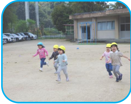
広い園庭で好きな遊びを思う存分楽しめます