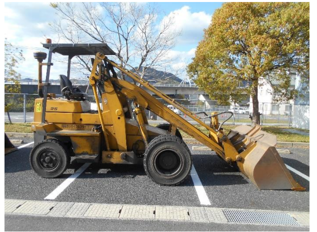
外観 ショベルローダNo.2