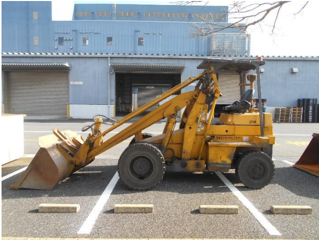
外観 ショベルローダNo.1