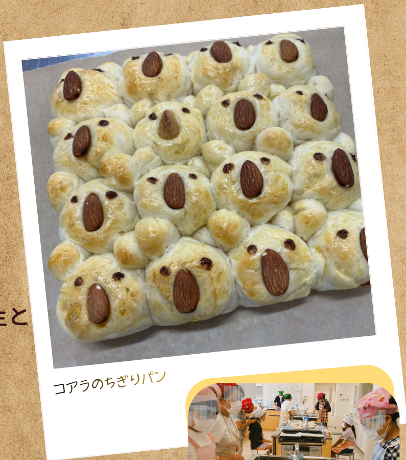
コアラのちぎりパン