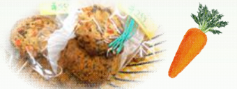
準備された試食用のクッキー (にんじんが入っています)

野菜の保存方法、大量消費の仕方など、たくさん教えていただいて参考になりました。(参加者アンケートより)