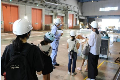
通常は上から見るプラットフォームに下りることができます。

昨年に引き続き、今年も夏休み期間中に通常の見学コースに加えて、バックヤードを見学できる特別な見学企画を実施します。参加資格は小学校4年生以上の市民。大人だけのグループ、個人での参加もOKです。この機会に、周南市のごみ資源化への取り組みについて考えてみませんか。