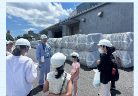
圧縮梱包機を見たのち、再生工場に送り出される前の圧縮梱包品を保管している場所を見学します。