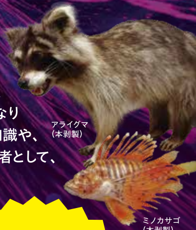
アライグマ (本剥製)

近年、科学技術の進歩によって、私たちの生活は格段に便利になっています。その一方で、自然にふれる機会が減り、多種多様な生き物が「危険」「迷惑」「不快」として嫌われるようになりました。本展では、彼ら「悪者」にされてしまった生き物にスポットを当て、偏見に対する正しい知識や、危険性に対する対処法、親しみやすいポイントなどを多角的に紹介します。同じ地球に生きる者として、彼ら野生生物のことを知り、共に歩む未来を考えてみましょう。