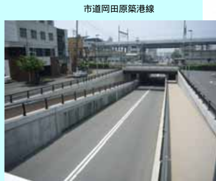
市道岡田原築港線