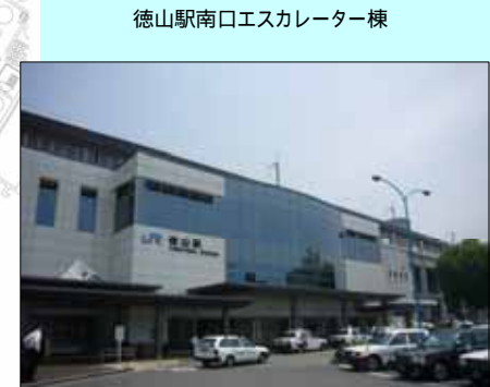
徳山駅南口エスカレーター棟