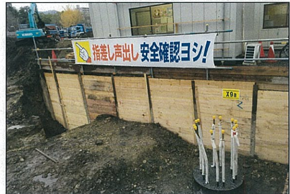
【横矢板設置完了(一部)】

親杭を打設完了後、横矢板を設置します。土を深さ約1.5mごとに掘削し、厚さ3cmから5.5cmの板をH鋼とH鋼の間に挟む手順で構築していきます。