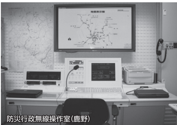
防災行政無線操作室(鹿野)