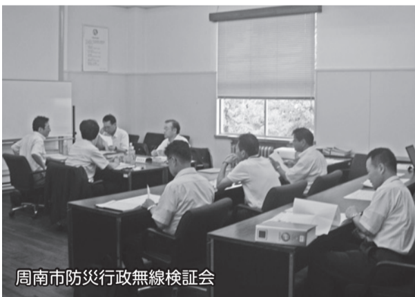
周南市防災行政無線検証会