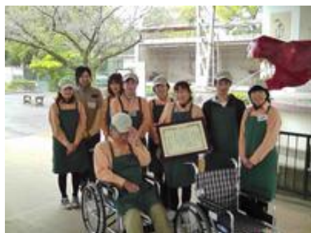
【贈呈された車いす】

また、プルタブ集めにより車椅子を入手し、平成21年度から毎年2台、のべ8台の車椅子を動物園に贈呈されています。