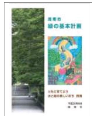
【周南市緑の基本計画】