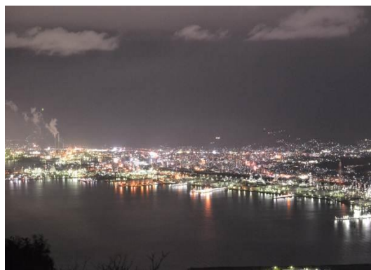
【太華山からの夜景】

平成24年度は、現状の問題点や整備について、地元と行政の情報共有を図り、美しい多島海景観の展望地として、より多くの方に親しまれるよう景観整備の計画策定等を進めています。