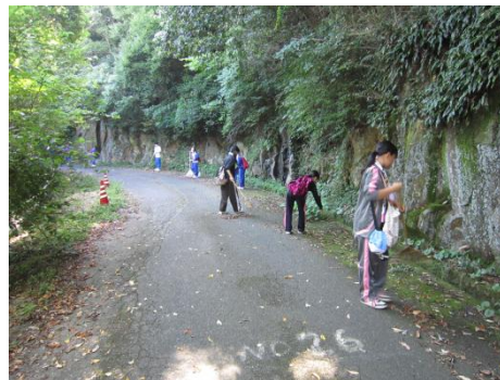
【太華山での清掃活動】