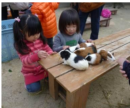
【小動物とのふれあい】