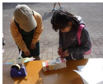
【牛乳パックを使った工作】

平成24年度末現在、38人が動物とのふれあい活動のサポートや工作イベントの企画・運営など多岐にわたり活躍されています。