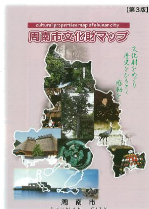
【周南市文化財マップ】

市内の指定文化財（国指定 5、県指定 16、市指定 68、登録文化財 7）を地図と写真、簡単な解説を載せてわかりやすく紹介しています。