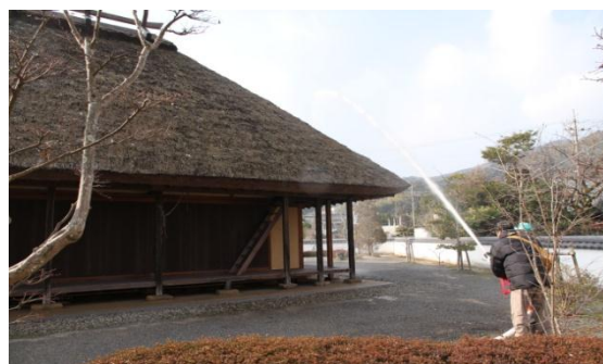
【山田家本屋（県指定有形文化財）消火訓練】

平成24年文化財防火デーに合わせて山田家本屋保存会、近隣住民が参加し、西消防署西部出張所協力のもと、平成25年1月26日に県指定文化財「山田家本屋」（湯野）において消火訓練を実施しました。