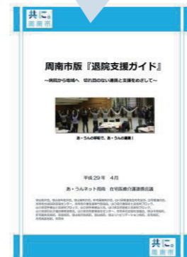
周南市版退院支援ガイド（冊子）

各様式や、詳しい内容は、『退院支援ガイド（冊子）』をご覧ください。 ※周南市HPからダウンロード可。