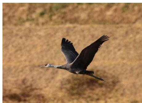
【平成23年度に放鳥したツル】

平成23年11月23日に1羽を放鳥し、平成24年3月21日に野鶴と一緒に合計7羽が北帰行しました。