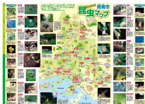
【周南市昆虫マップ】

自然環境保護の啓発や子供たちの環境学習用として、毎年市内の小学4年生全員に配布しています。