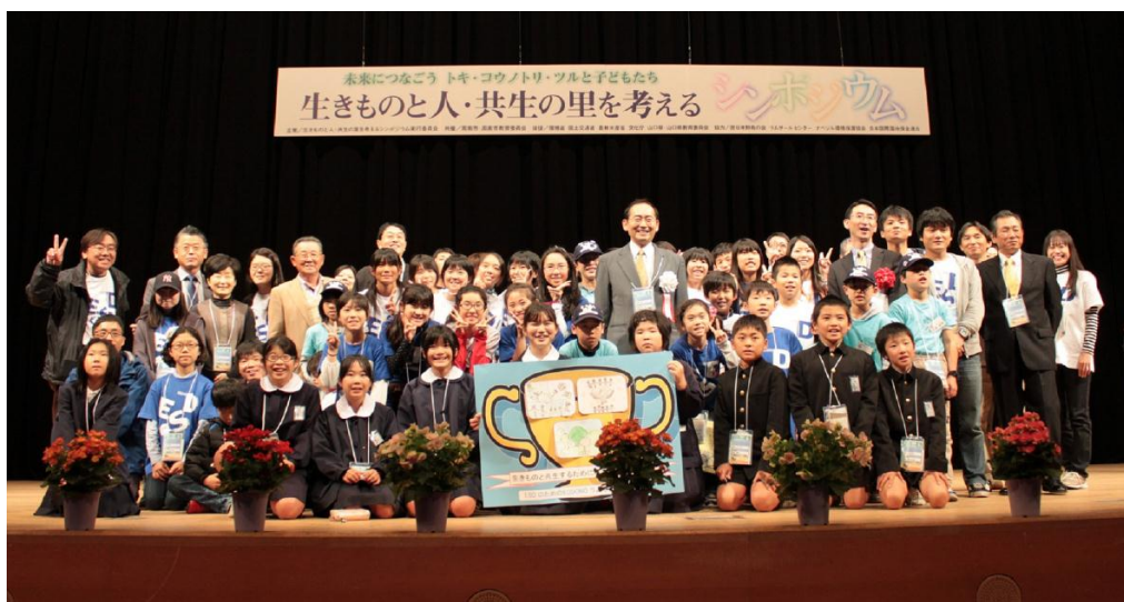
【生きもの与人・共生の里を考えるシンポジウム】