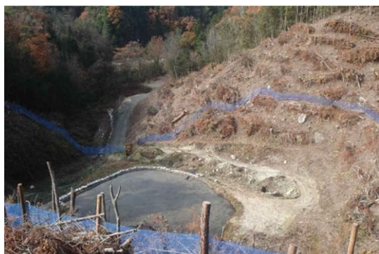
【寄付金を活用したねぐら整備】