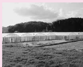
補助により設置したビニールハウス

事業費 115,726千円 事業の概要 青年の就農意欲の喚起と就農後の定着を図るため、農業研修期間および就農直後の者に対する支援を実施する。