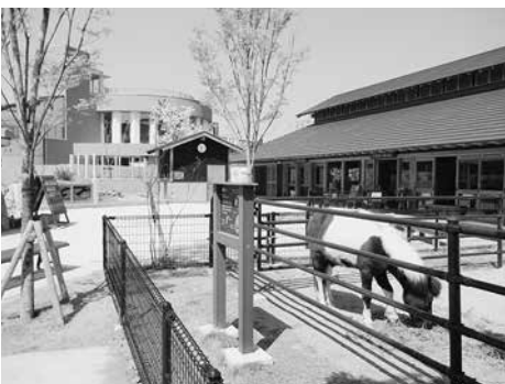
リニューアルが進む徳山動物園

答 本格的にリニューアル工事が始まって平成28年度で全体の3分の1が終了予定である。リニューアルによる新しい動物園を披露し、また新たなサービスも検討したい。その