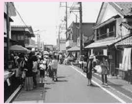
いっておかえり鹿野市

事業費 4,100千円 事業の概要 鹿野地区へ集落支援員を配置し、夢プランづくりやその実現に向けた地域の主体的な取り組みを支援する。