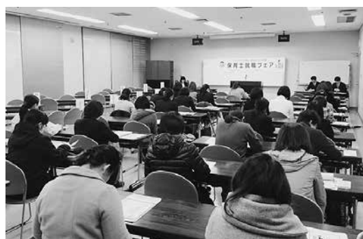
保育士就職フェア