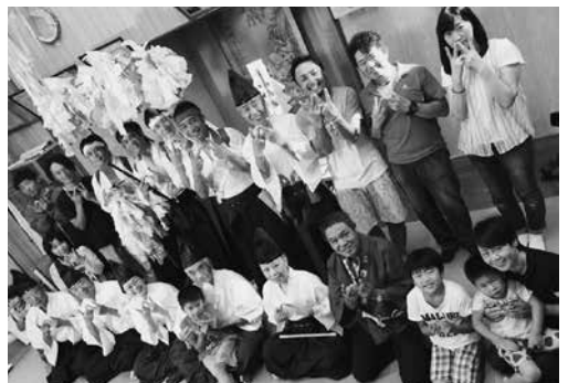
神楽でまちづくりプロジェクト

答 5・6年生は教科化による70時間の枠がカリキュラムに吸収できない。35時間は増やしたが、残り35時間については学校の裁量で何とかするという流れになっている。