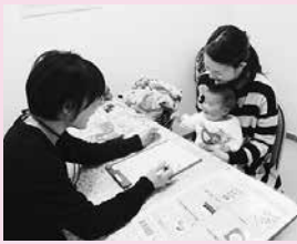
専門職による相談

事業費 17,138千円 事業の概要 妊娠・出産・子育てに関する相談窓口「子育て世代包括支援センター」で、全ての妊産婦、乳幼児、児童とその家庭への支援体制と地域全体で子育てを支える環境を整備する。