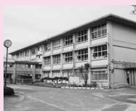
改修工事予定の榎浜小学校

事業費 160,753千円 事業の概要 安心して快適に学べる教育環境確保のため、大規模改修や非構造部耐震改修を実施する。