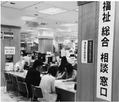
もやいネットセンター

もやいネットセンターや自立相談支援センターで相談を受け付けており、状況に応じて福祉や医療についての情報提供やひきこもり地域支援センターにつないでいる。また、しゅうなん若者サポートステーションや自立支援センターで就労支援を行っている。