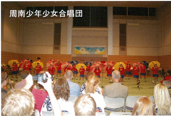
周南少年少女合唱団