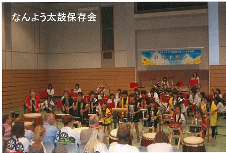
なんよう太鼓保存会

周南少年少女合唱団と帆船日本丸を愛する男性合唱団は、ともにデルフザイルから招待を受け、現地で開催された帆船祭り「デルフセイル」に参加（周南少年少女合唱団：2009年、帆船日本丸を愛する合唱団：2003年）。