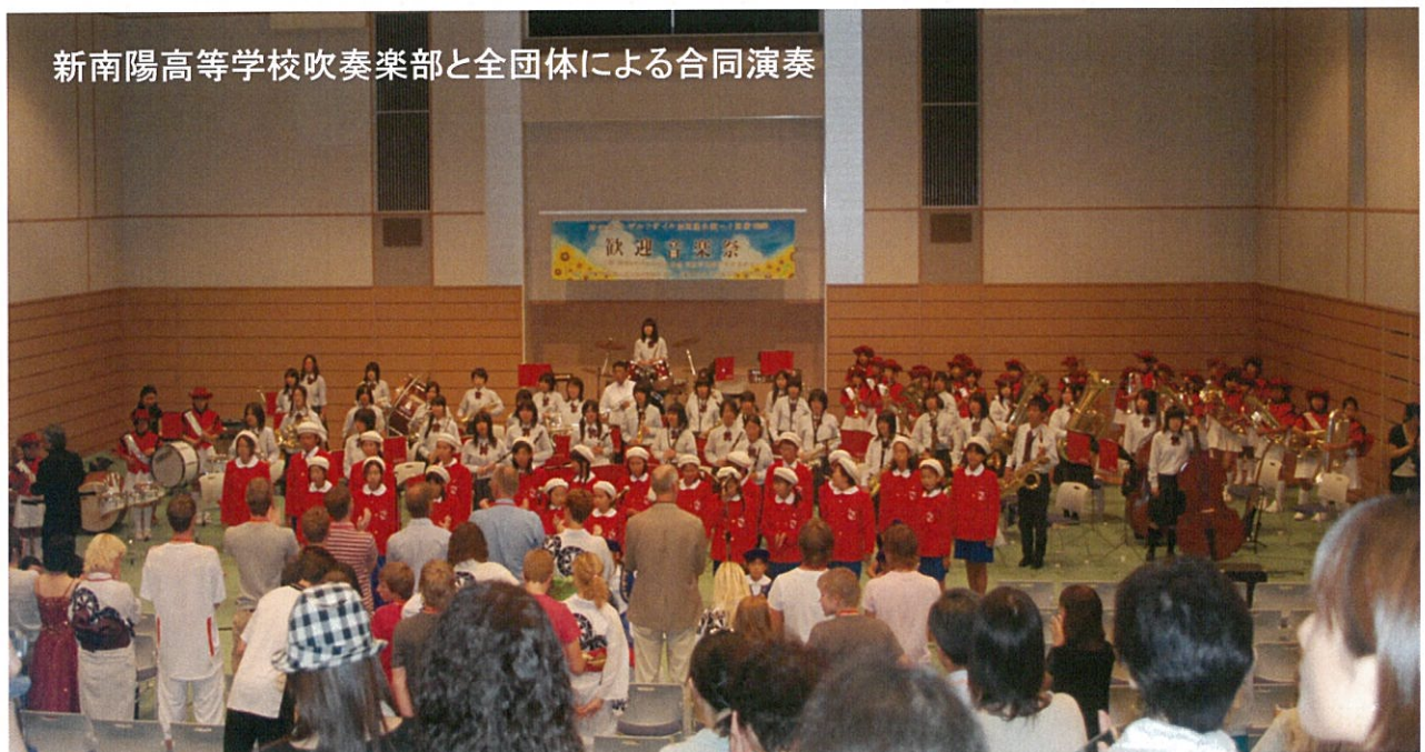
新南陽高等学校吹奏楽部と全団体による合同演奏