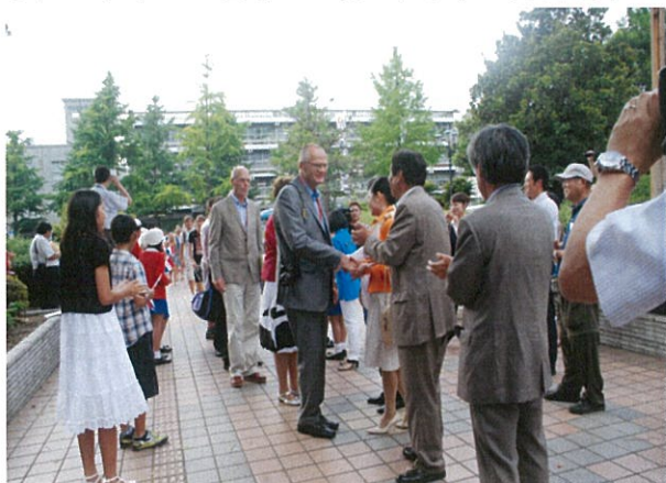
市民館の前でお出迎え

デルフザイル市訪問団の皆さんを歓迎するため、周南市長夫妻・議長・副市長はじめホストファミリーや周南少年少女合唱団の皆さんでお出迎え。周南少年少女合唱団は2009年にデルフザイルで開催されたデルフセイルにて、フローニンゲン州歌をオランダ語で披露し、現地の人々に大きな感動を与えました。デルフザイルの皆さんと約1年ぶりの再会を果たしました。