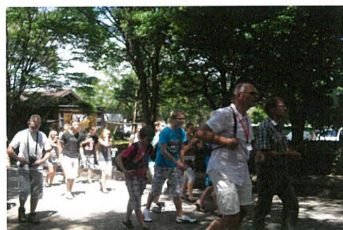
永源山に到着する一行

デルフザイル訪問団のなかには、音楽協会に所属し楽器を演奏する方も多いので、皆とても真剣に聞き入っていました。