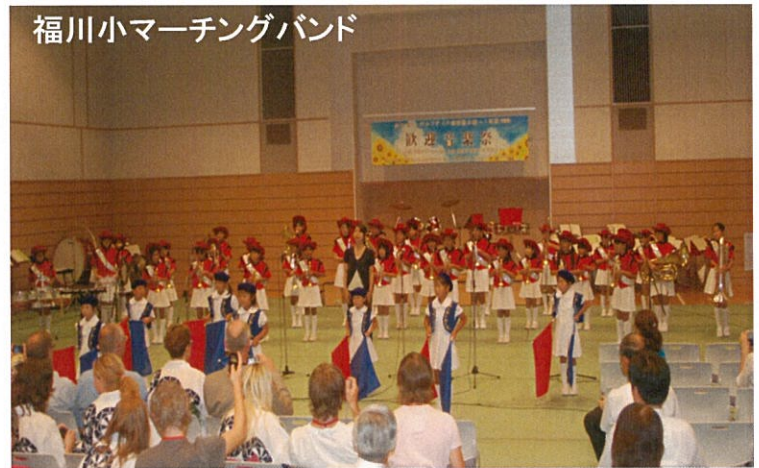
福川小マーチングバンド

市内の5団体と横浜からゲスト参加された 帆船日本丸を愛する男性合唱団の皆さんが 歌・ダンス・太鼓と様々なステージを披露し、 デルフザイル市長夫妻はじめ、訪問団員と 観客を魅了しました。