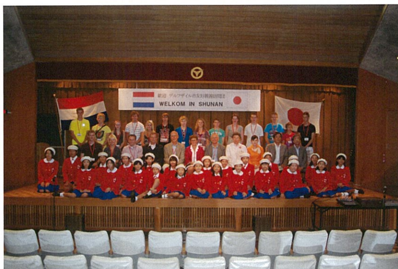
全員での記念写真

訪問団員と同行者を含め、16名がホストファミリーと対面。皆、緊張した様子でしたが、家族に温かく迎えられ安心したようでした。