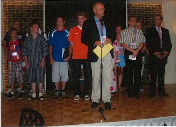
受入に携わった全ての方に感謝を述べる デルフザイル市長

周南市での滞在も今日が最終日です。到着した日には、少し緊張した様子だった青少年とホストファミリーの皆さんも、すっかり打ち解け、和やかな雰囲気でお別れ会を楽しみました。