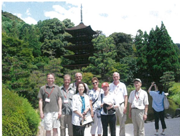
瑠璃光寺 五重塔の前にて

市長夫妻及び同行者一行は、山口県内の観光地を視察。山口市の瑠璃光寺と防府市の天満宮・毛利氏庭園を訪れました。五重塔や日本庭園などを見学し、日本の伝統的な建築物や庭園の美しさに感動されていました。青少年はホストファミリープログラムで、それぞれの家族と秋芳洞、大華山、大津島：回天などを訪れ、家族と最後の1日を過ごしました。