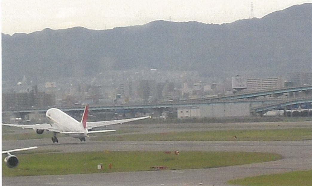
デルフザイル市訪問団を乗せて飛び立つ飛行機