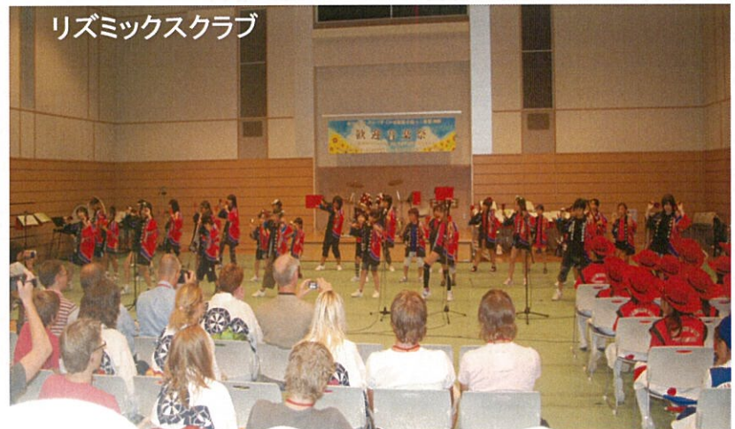
リズムックスクラブ