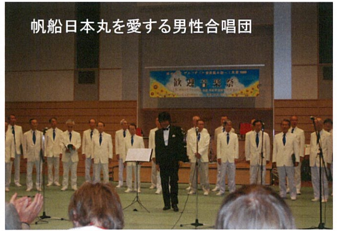
帆船日本丸を愛する男性合唱団

周南少年少女合唱団と帆船日本丸を愛する男性合唱団は、ともにデルフザイルから招待を受け、現地で開催された帆船祭り「デルフセイル」に参加（周南少年少女合唱団：2009年、帆船日本丸を愛する合唱団：2003年）。