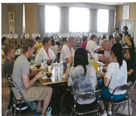
手作りの日本食を堪能