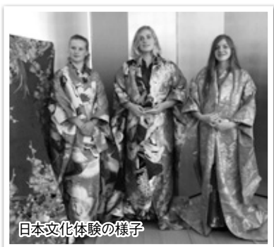
日本文化体験の様子

申込み 4月20日(金)から、電話で、観光交流課コンベンション・国際交流推進担当 ☎0834-22-8372