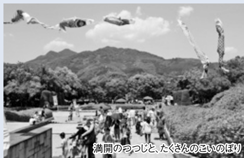
満開のつつじと、たくさんのこいのぼり

問合せ 公園花とみどり課内永源山公園つつじ祭り実行委員会事務局 ☎0834-22-8402