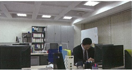
1 パワハラの加害者になったら