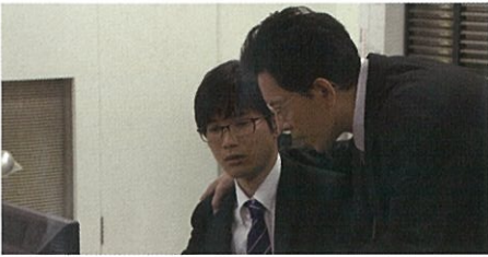
パワハラ事例4 過大な要求