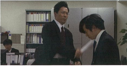
パワハラ事例1 身体的攻撃