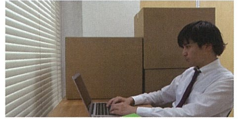
パワハラ事例3 人間関係からの切り離し