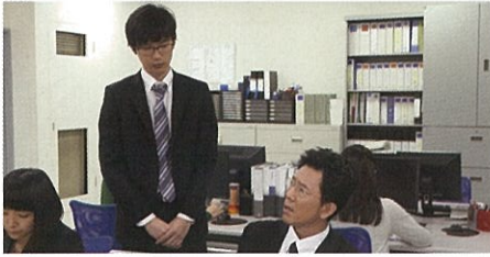
パワハラ事例2 精神的攻撃