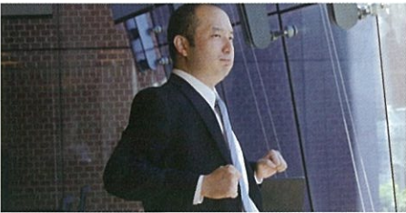
4 アンガーマネジメント