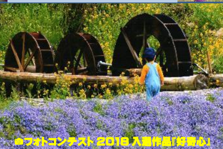
◎フォトコンテスト2018 入選作品「好奇心」