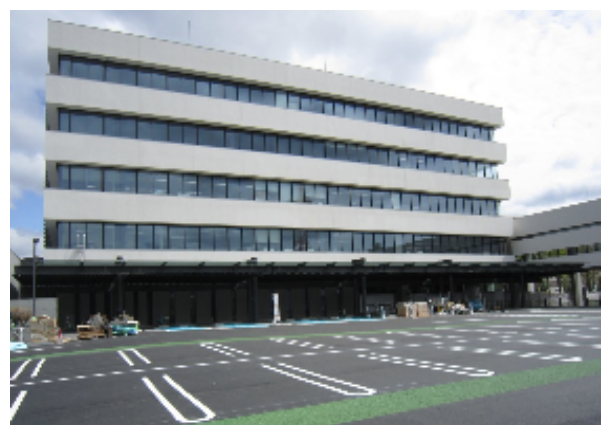
◆庁舎棟南側（玄関庇）