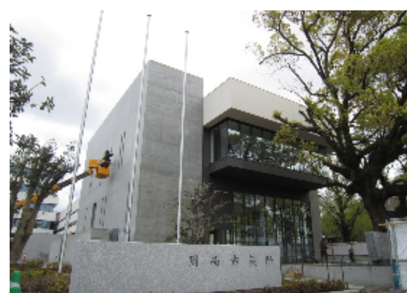
◆シビックプラットホーム南側